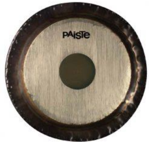
Tam-tam : cercle de métal s'apparentant au gong.