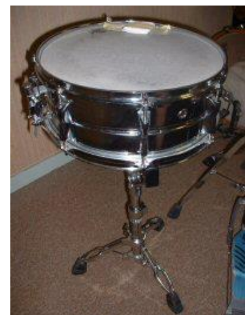
La caisse claire a un son s'apparentant au tambour militaire. Elle possède sous la peau des fils de métal qui lui donnent une résonance métallique.