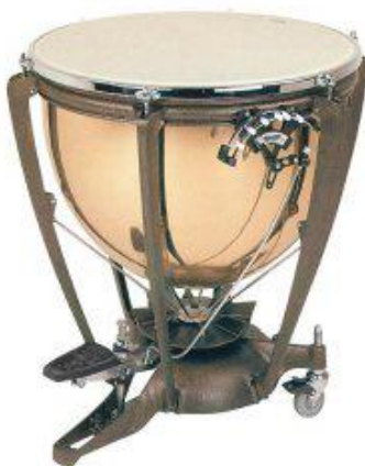
Les timbales sont généralement groupées par trois ou quatre et sont jouées par le timbalier.