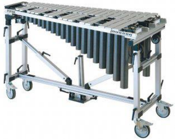
Vibraphone : clavier à lames de métal avec tuyaux résonateurs et pédale. Le vibrato peut être accentué avec l'intervention de l'électricité.

Ces instruments sont joués avec deux ou quatre mailloches.