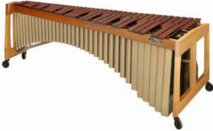
Marimba : clavier à lames de bois avec de grands tuyaux pour la résonance.