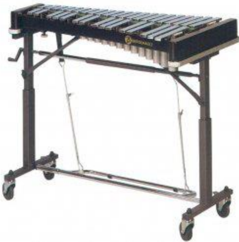
Glockenspiel : clavier à petites lames de métal et tuyaux courts pour la résonance. Le son est plus sec que le vibraphone et s'apparente à celui d'un carillon

Ces instruments sont joués avec deux ou quatre mailloches.