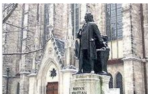
J.-Sebastian Bach (1685-1750)