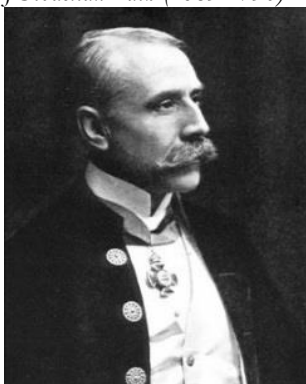
Sir Edward Elgar (1857-1934)

Une heure à la rencontre des compositeurs classiques programmés dans la saison des concerts symphoniques. Au travers du répertoire de musique de chambre, partagez avec les solistes de l'Orchestre des moments musicaux intimes et commentés pour vous guider dans cet univers de la musique classique, accessible à tous !