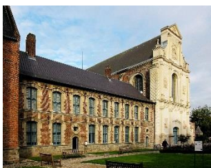
Musée de la Chartreuse

Après un accueil café privilégié dans le cloître du Musée de la Chartreuse, découverte des collections sur le thème de Noël.