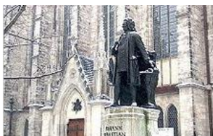
J.-Sebastian Bach (1685-1750)