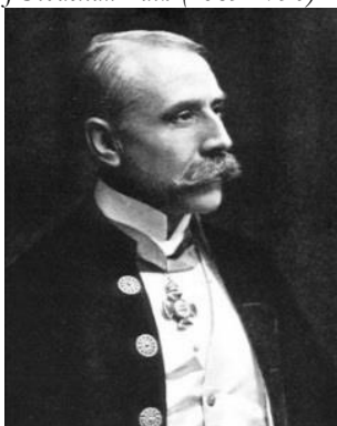
Sir Edward Elgar (1857-1934)

Une heure à la rencontre des compositeurs classiques programmés dans la saison des concerts symphoniques. Au travers du répertoire de musique de chambre, partagez avec les solistes de l'Orchestre des moments musicaux intimes et commentés pour vous guider dans cet univers de la musique classique, accessible à tous !