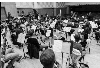
L'Orchestre de Douai sous la direction de Jean-Jacques Kantorow