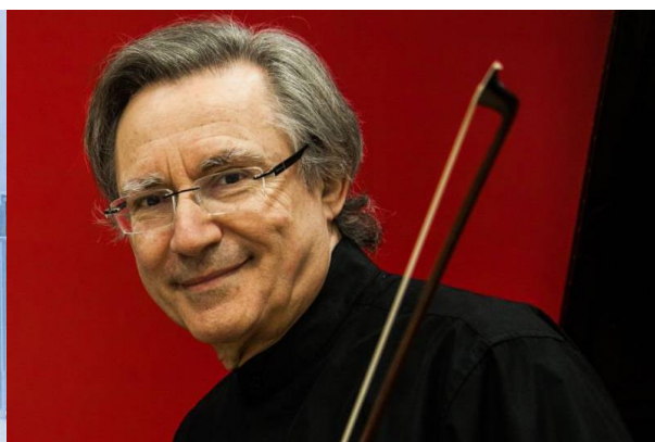
Jean-Jacques Kantorow