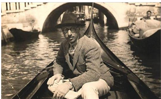
Stravinsky à Venise en 1925