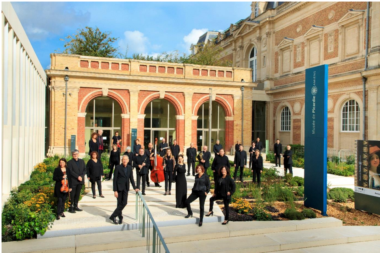
L'Orchestre de Picardie

Orchestre de Douai – Région Hauts-de-France