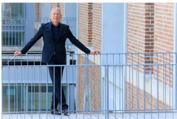
Orchestre de Picardie