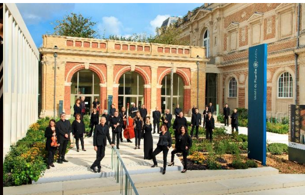
Orchestre de Picardie