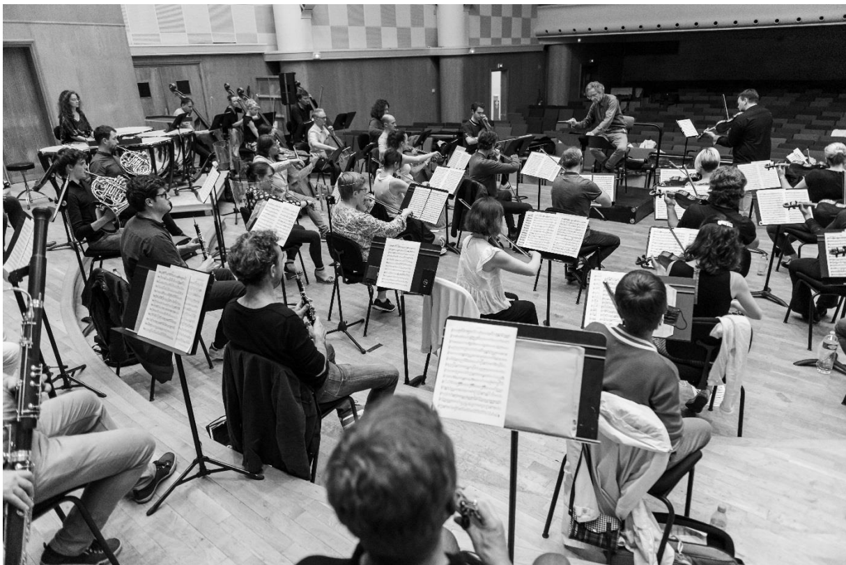
L'Orchestre de Douai placé sous la direction de Jean-Jacques Kantorow