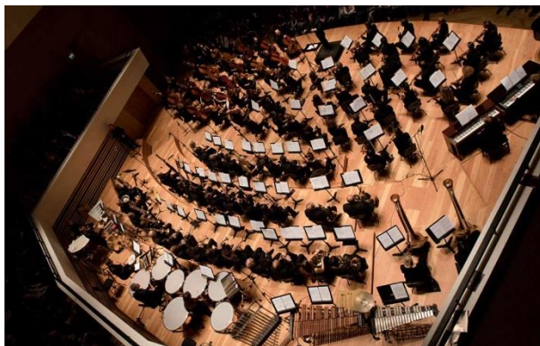
Orchestre de Douai