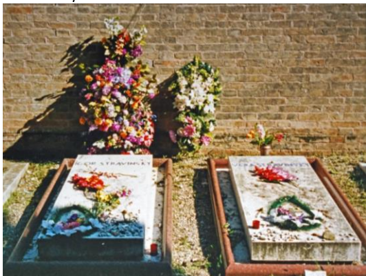
Les tombes d'Igor et Vera Stravinsky à Venise