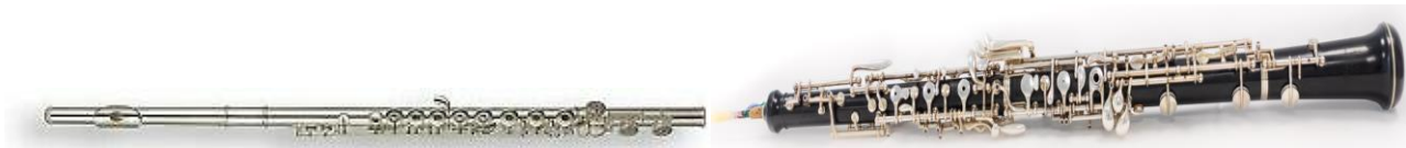
La flûte traversière

♫ Les vents : flûte, hautbois, clarinette, basson, cor, trompette, trombone,