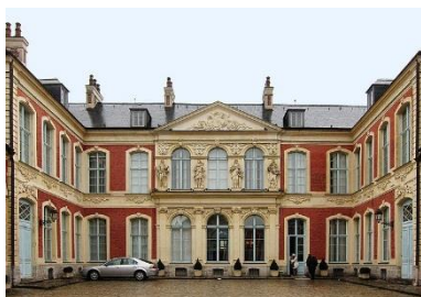
Hôtel d'Aoust, XVIIIème siècle