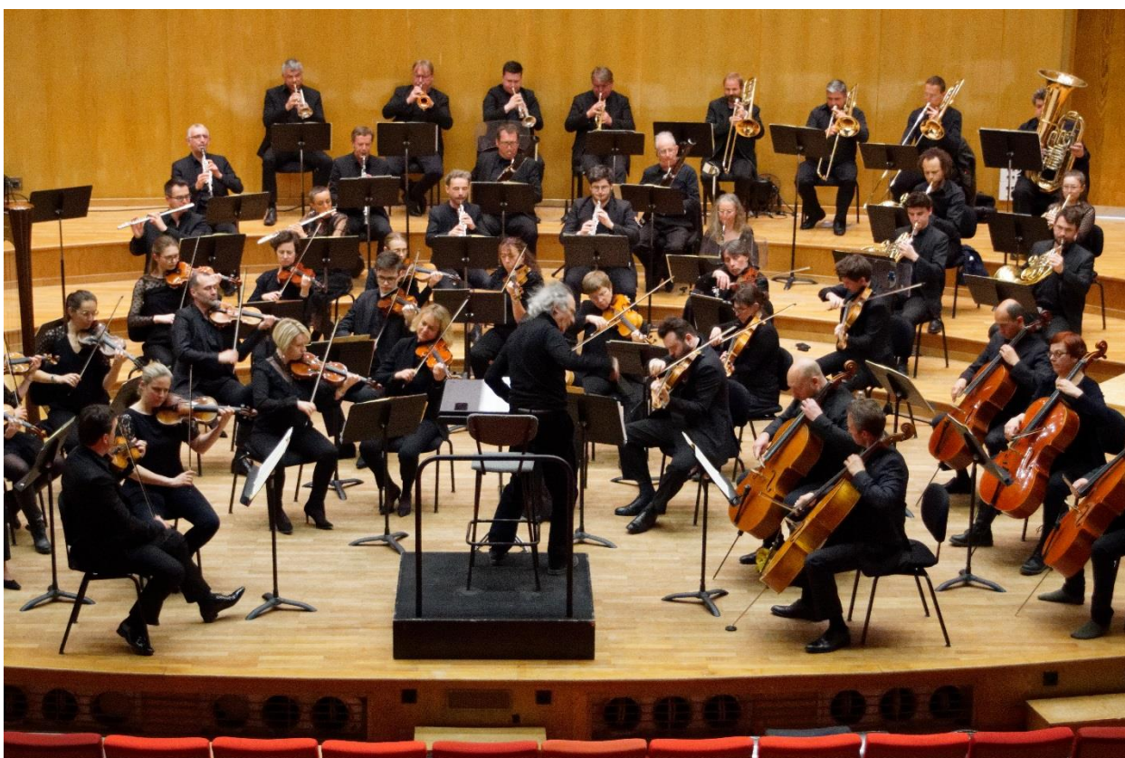
L'Orchestre de Douai sous la direction de Jean-Jacques Kantorow