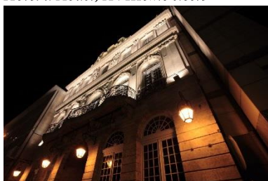
Hôtel du Dauphin, XVIIIème siècle