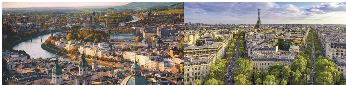
De Salzburg à Paris

Samedi 17 Décembre 2022 – 20h – Complexe Sportif d'Estaimpuis (Belgique) Dimanche 18 Décembre 2022 – 16h – Auditorium Henri Dutilleux de Douai Dimanche 8 Janvier 2023 – 15h et 20h30 – Le Cratère d'Alès