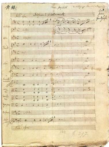
Partition autographe du début du 1 er mouvement